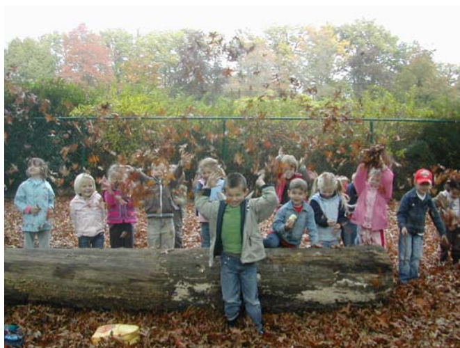
Uitstap naar Bokrijk

De weerman voorspelt mooi weer. Dat is al een goede start voor een daguitstap met alle kleuters. Wat is het spannend wachten op een bus die maar niet komen wil. Daar is ze dan.